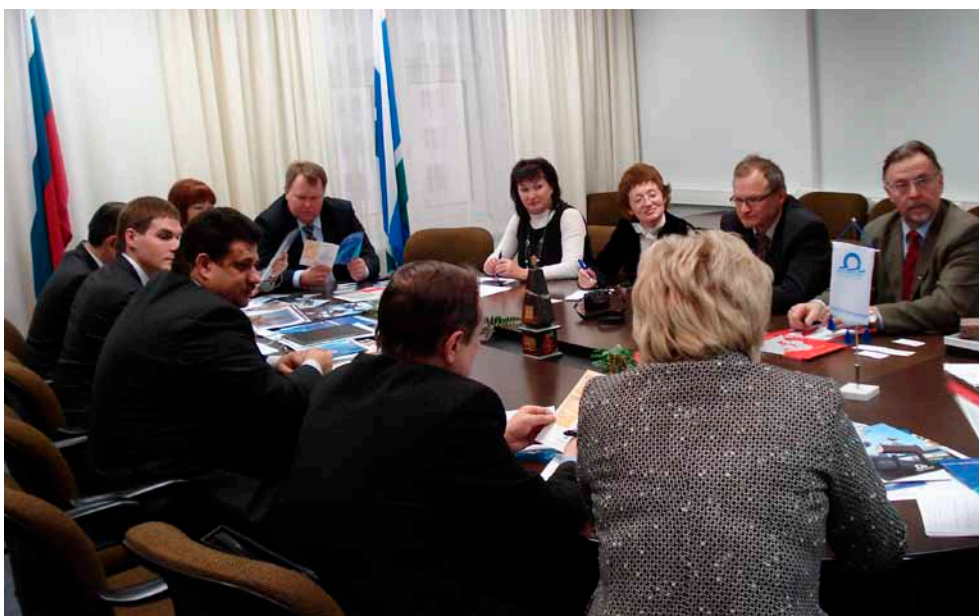
Tapaaminen Jekaterinburgin hallinnon kanssa.

Valtuuskunta tapasi vierailun aikana alueen hallinnon, matkailun ja logistiikka-alan edustajia.