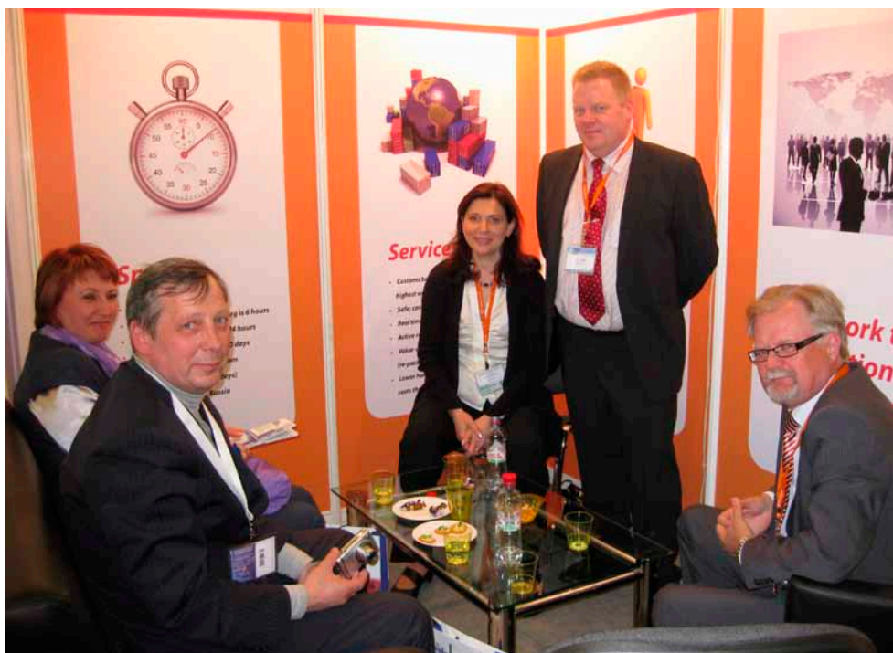
Venäläisiä asiakastapaamisissa TransRussia-messuilla.